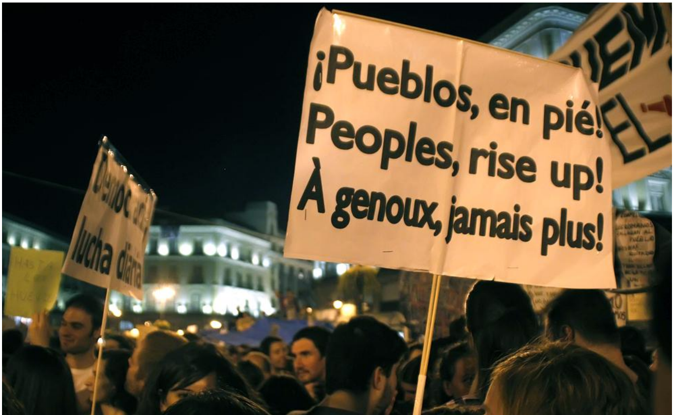
Mouvement de protestation du 15M contre les mesures d'austérité à Madrid, mai 2011.