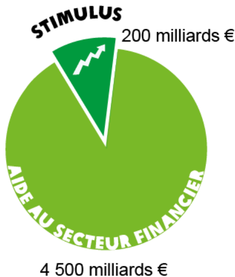
Figure 1 : Le plan de relance économique de l'UE vs les aides versées au secteur financier 8

En 2010, de nombreux gouvernements européens ont mis un terme à leurs programmes de relance et se sont lancés dans une série de mesures d'austérité. Certains pays, comme la Grèce, l'Espagne, l'Irlande et le Portugal, ont dû prendre des mesures d'austérité en vertu des modalités des accords de renflouement conclus avec la Banque centrale européenne, la Commission européenne et le Fonds monétaire international (FMI). D'autres, comme le Royaume-Uni, ont librement choisi de mettre en place des mesures d'austérité, qu'ils considéraient comme le meilleur moyen de surmonter une dette publique et des déficits budgétaires élevés.